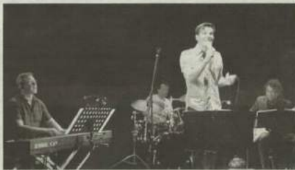
Une soirée au Brésil.